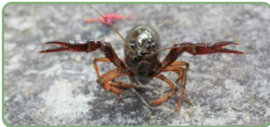
Écrevisse de Louisiane ( Procambarus-clarkii )

Président du Conservatoire d'espaces naturels Centre-Val de Loire